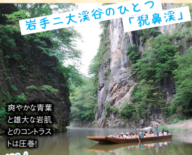
岩手二大深谷のひとつ「狢鼻溪」