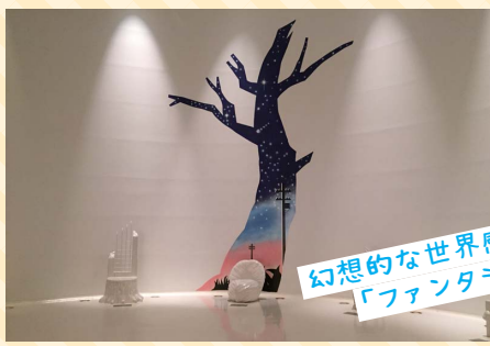
周辺には「宮沢賢治記念館」や「ボランの広場」など賢治ゆかりのスポットも多数あります。 幻想的な世界感が魅力! 「ファンタジックホール」