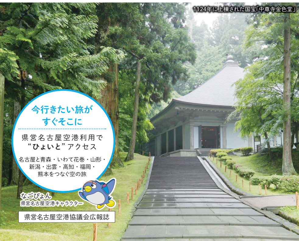
1124年に上棟された国宝「中尊寺金色堂」