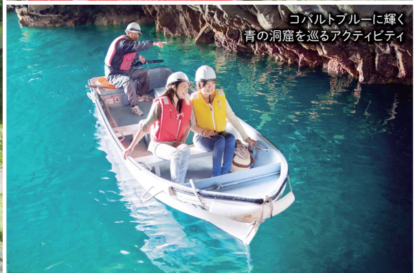
コバルトブルーに輝く青の洞窟を巡るアクティビティ