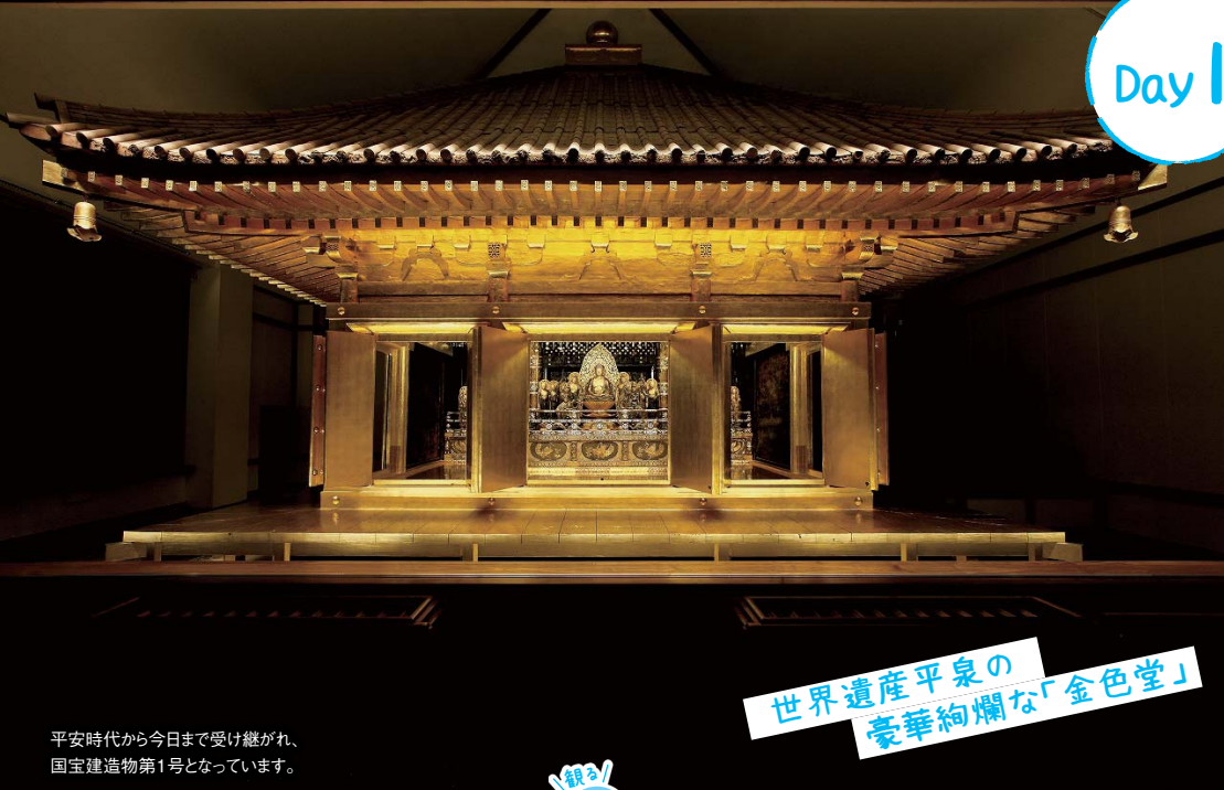
世界遺産平泉の豪華絢爛な「金色堂」

豊かな自然に恵まれた岩手県には絶景の名所、世界遺産、美味しいご当地グルメが勢揃い。旅がもっと楽しくなる。令和元年「今行くべきおすすめスポットを紹介」を紹介します!