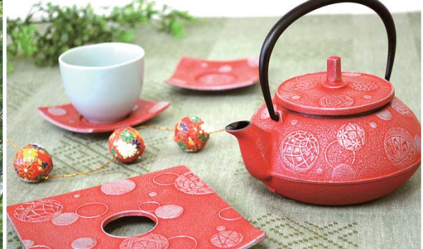
個性溢れるデザインが人気「岩鑄」の南部鉄器